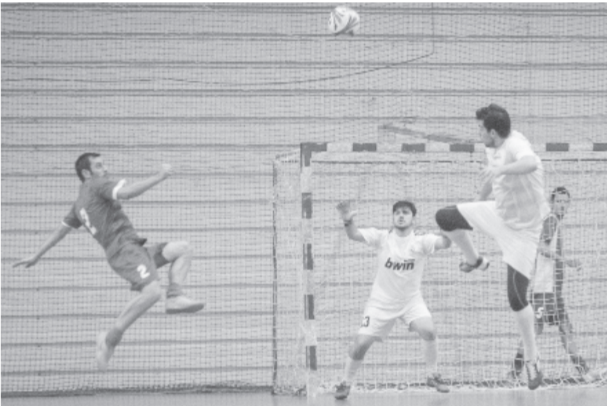
Levegőben játékos, labda.

Csak ebből messzemenő következtetést ne tessenek deriválni!