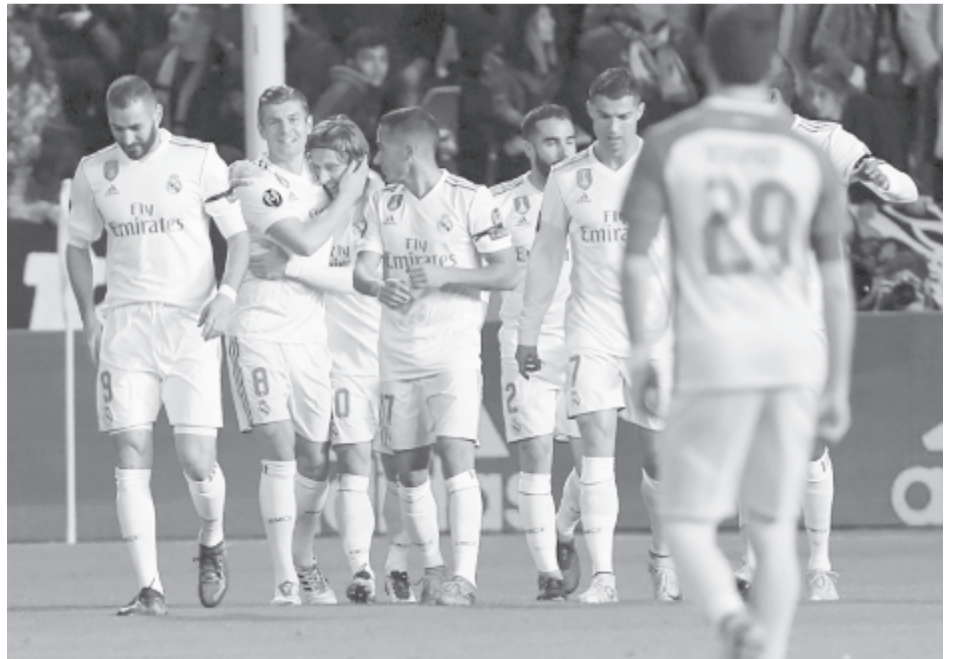
Góllal jutott tovább a Real Madrid

louse – Metz 0-0, Strasbourg – Stade Rennes 2-1, Caen – Nice 1-1, Lyon – Montpellier HSC 0-0, Bordeaux – Olympique Marseille 1-1. Az élcsoport: 1. Paris St. Germain 35 pont, 2. AS Monaco 29, 3. Lyon 26.