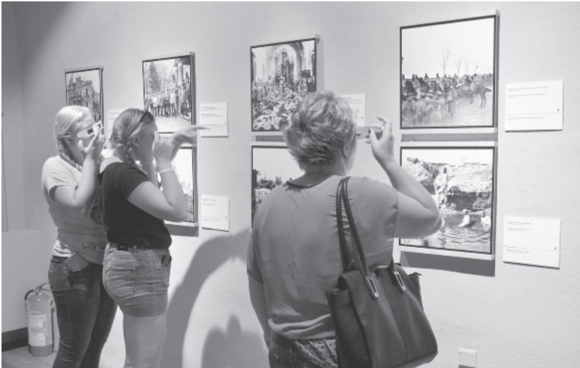
Kiállítás a Csíki Székely Múzeumban

is bemutatásra kerülő térhatású fotók, de más, a háború időszakában készült fényképek igen. Emellett ez év tavaszán egy, a román Kulturális Minisztérium által támogatott, Maros mentiek a Nagy Háború lövészárkaiban című projekt keretében gyűjtésbe kezdtek, aminek célja, hogy minél több, a háborúhoz kapcsolódó tárgyat, emléket összegyűjtsenek. Ezek lehetnek fényképek, levelezőlapok, kitüntetések, emléklapok vagy bármilyen tárgy, ami a háborúban részt vett családtag után megmaradt. A gyűjtés célja, hogy 2018-ban, a centenáriumban alkalmával a múzeum saját kiállítással is megemlékezzen a fontos eseményről. Akinek tehát bármilyen fotója vagy emléktárgya van, ami kötődik az első világháborúhoz, elviheti a Maros Megyei Múzeum néprajzi részlegéhez (Toldalagi-palota, Rózsák tere), ahol a fotót beszkennek, tárgyak esetében a tulajdonos megegyezhet a múzeum munkatársaival, hogy kölcsön- vagy eladja azt a múzeumnak.